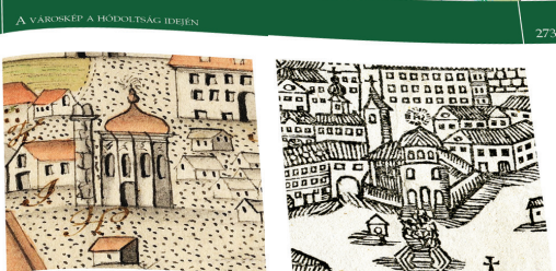
142-143. ábra. A török elemek lassú eltűnése a plebánia-templom 18. századi ábrázolásán. a) a még álló minaret Francisicus Foy városképén (18. század közepe); b) a dére nyitló bejárat, az új torony és a kolostorba vezető függőfolyosó Joseph Kieller metszetén (1776)

PÉCS TÖRTÉNETE A HÓDOLTSÁG KORÁBAN (1543-1686)