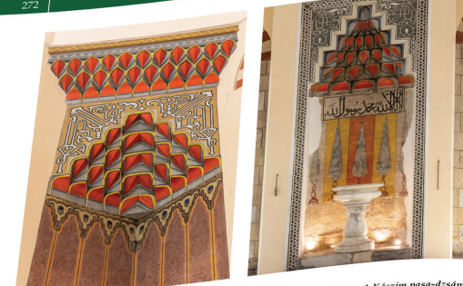
137. ábra. Sztalaktitboltozat a Kászim pasa-dzsámiában